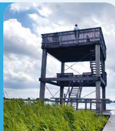
Vogelbeobachtungshütte beim Burgumer Mar

Vom Boot ab in die Pedale: Die Umgebung der Lits-Lauwersmeerroute kann auch bestens mit dem Fahrrad erkundet werden. Durch das sogenannte Fahrradroutensystem, das nun auch in Nord-Friesland angelegt wurde, kann man eigene kurze oder lange Fahrradtouren planen.